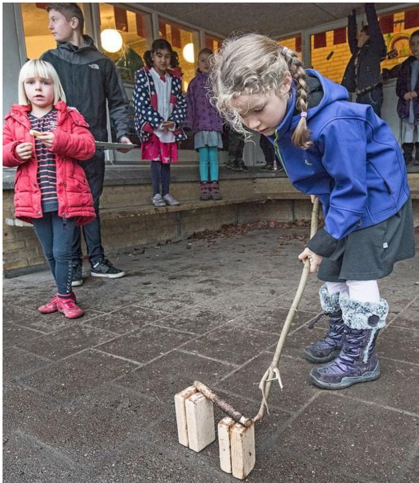
De yngste hyggede sig med middelalderspillet, hvor de med en gren skulle 'kaste' en pind. De lærte om tålmodighed og køkultur.

Emneugen startede med, at eleverne stemte om, hvornår de helst ville gå i skole. Et overvældende flertal stemte for 2014, men i fredags havde mange rykket deres stemme fra 2014 og 40 år baglæns til 1970'erne!